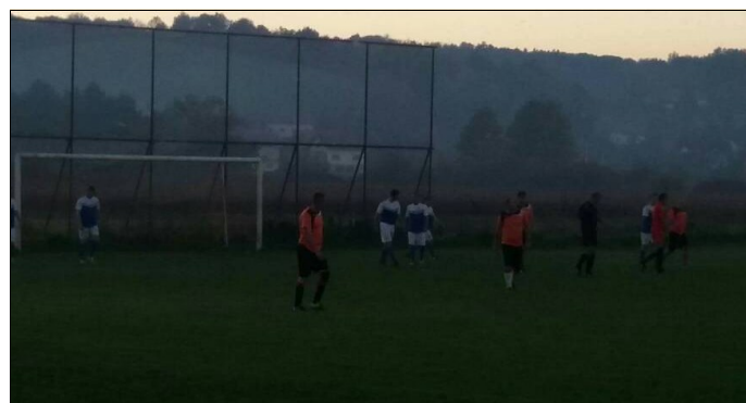
Slike s utakmice Vojnić 95 – Karlovac 1919