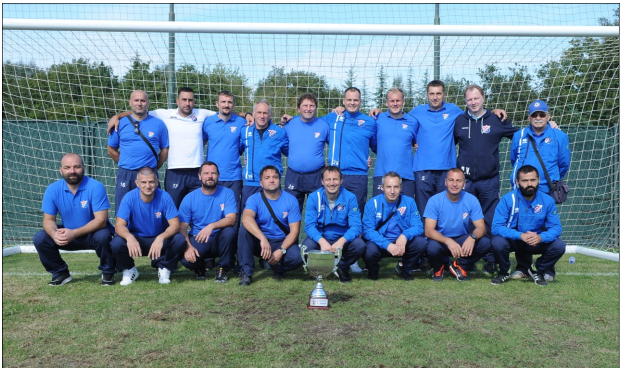
Veterani Zrinski Ozalj